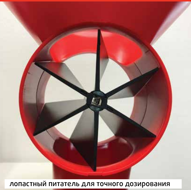
лопастный питатель для точного дозирования