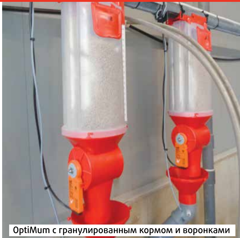
OptiMum с гранулированным кормом и воронками