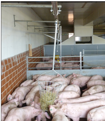
Figure 2: PlayLine avec corbeille en paille.