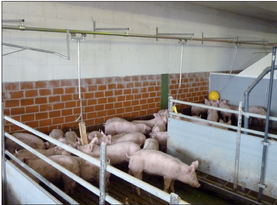
Figure 1: système PlayLine.