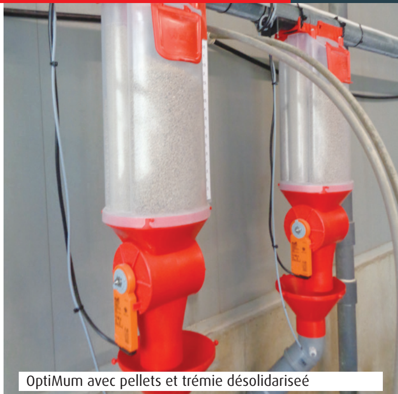
OptiMum avec pellets et trémie désolidarisé