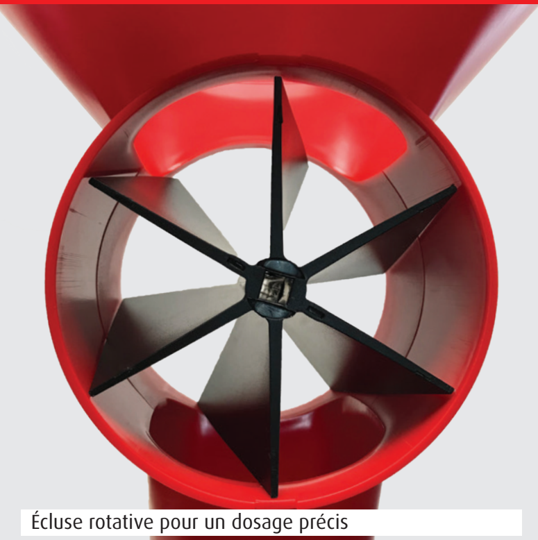
Écluse rotative pour un dosage précis