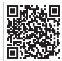
Vidéo : Demande d'alimentation par capteur pendulaire