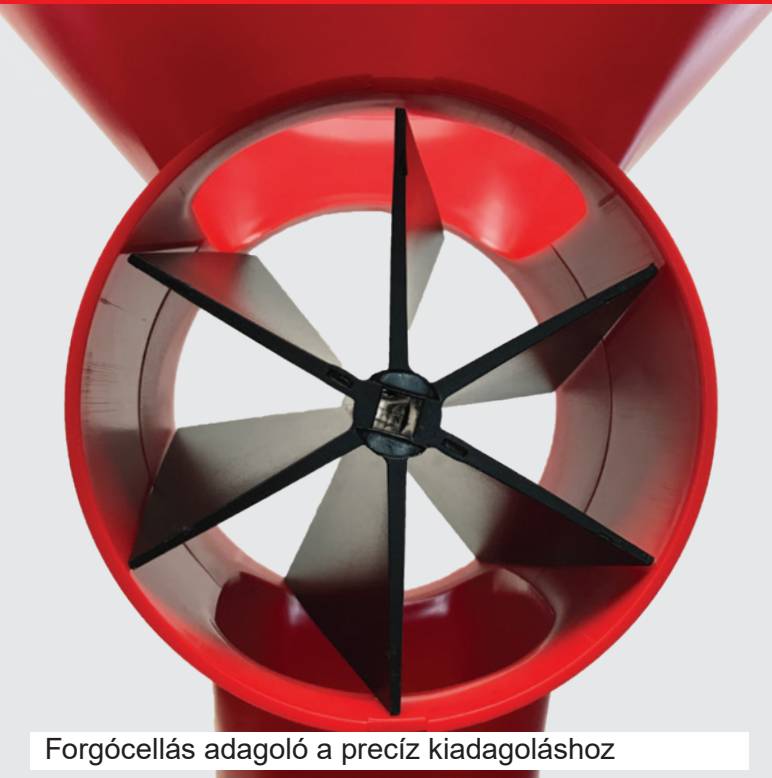
Forgócellás adagoló a precíz kiadagoláshoz