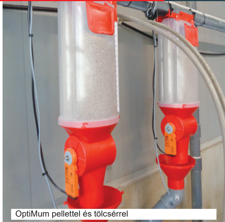
OptiMum pellettel és tölcsérrel